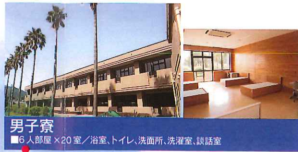
男子寮 ■6人部屋×20室/浴室、トイレ、洗面所、洗濯室、談話室