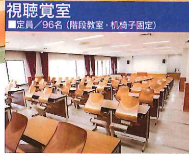
視聴覚室 ■定員/96名 (階段教室・机椅子固定)