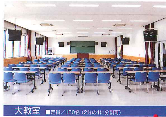
大教室 ■定員/150名 (2分の1に分割可)