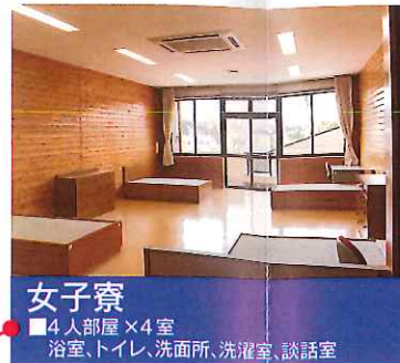
女子寮 ■4人部屋×4室 浴室、トイレ、洗面所、洗濯室、談話室