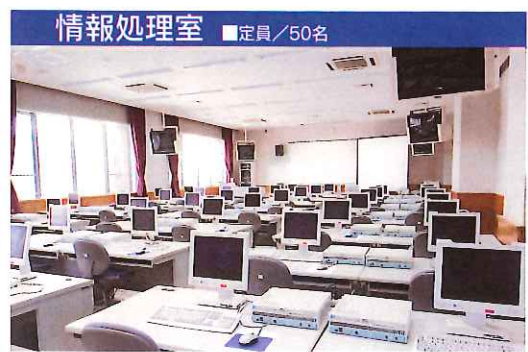
情報処理室 ■定員/50名