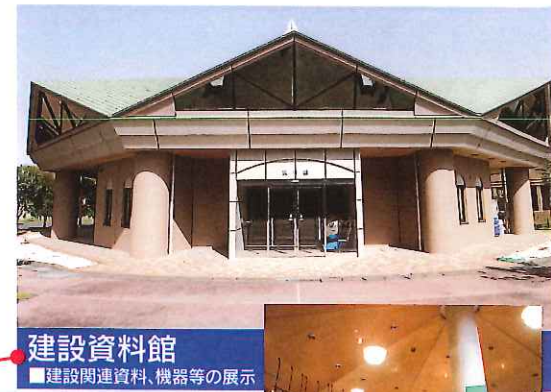
建設資料館 ■建設関連資料、機器等の展示