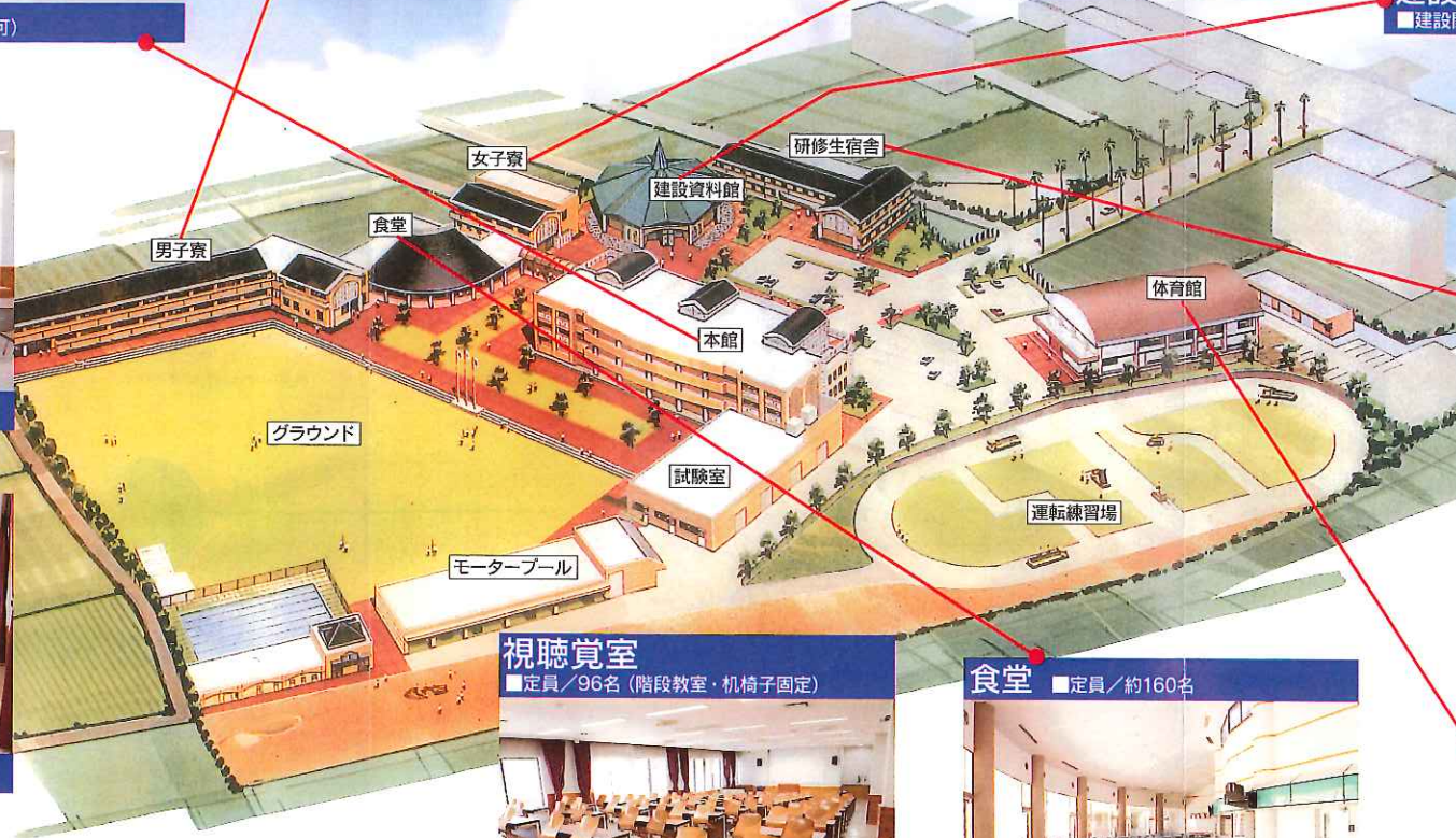
研修生宿舎 ■2人部屋×25室 浴室、トイレ、洗面所、洗濯室、談話室