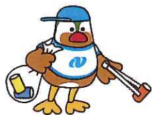
2014 長崎団体・大会キャラクター がんばくん(長崎県)