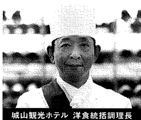
城山観光ホテル 洋食統括調理長