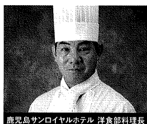
鹿児島サンロイヤルホテル 洋食部調理長