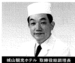
城山観光ホテル 取締役総調理長