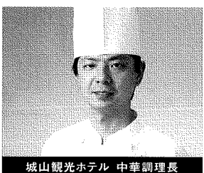
城山観光ホテル 中華調理長