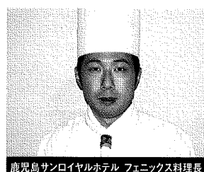
鹿児島サンロイヤルホテル フェニックス料理長